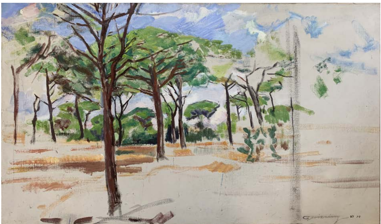
En el Pinar de Cabo Roche, 100 x 170 cm, óleo sobre lienzo, junio 2010