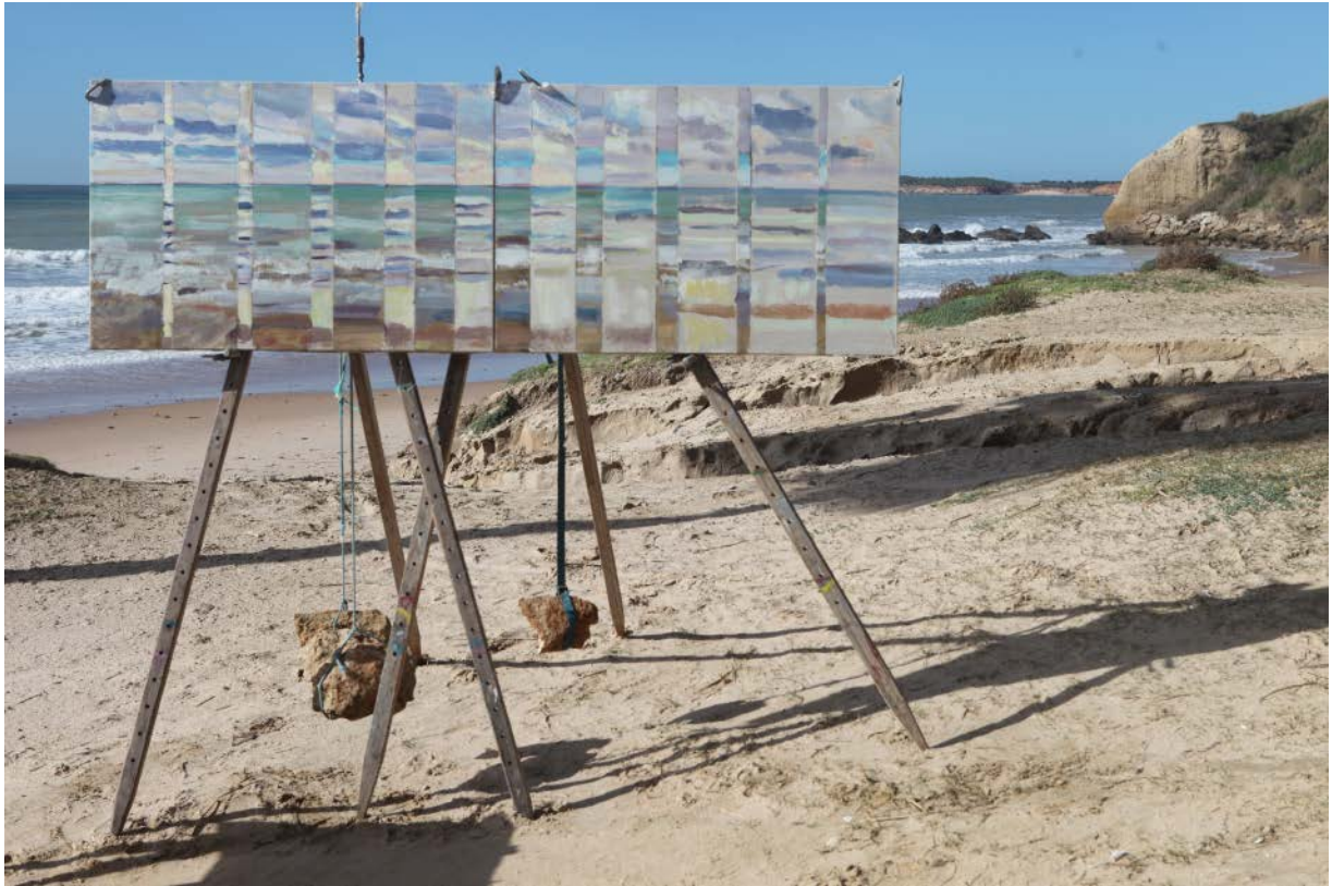
Playa de Conil, Crescendo versus disminuyendo, óleo sobre lienzo, 2 x 66 x 100 cm, octubre 2014