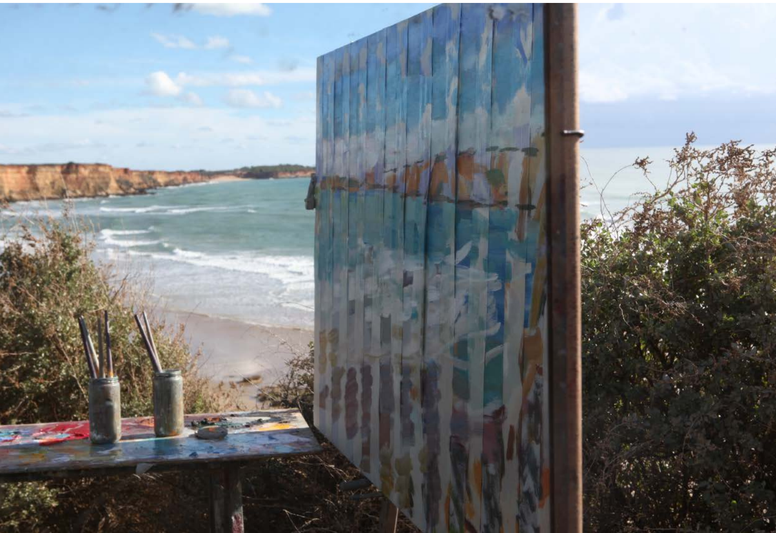
Mar y rocas, Fuente del Gallo (2014)