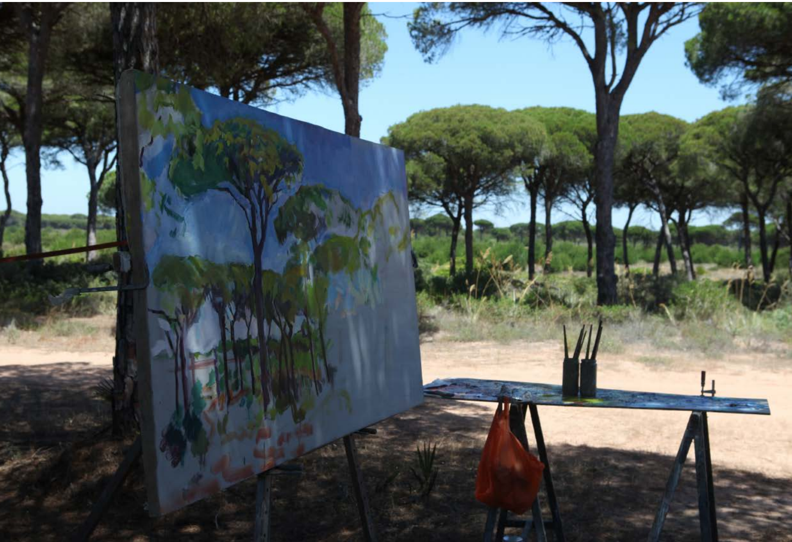
Pintando en en el pinar de Cabo Roche