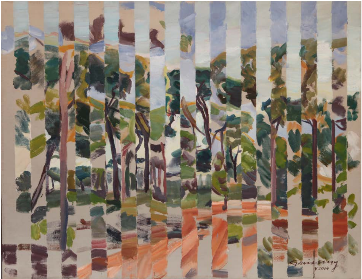
En el Pinar direccion Este-Oeste, óleo sobre lienzo, 89 x 116 cm, mayo 2014