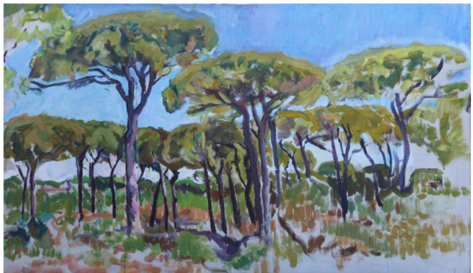
En el Pinar de Cabo Roche, óleo sobre lienzo, 114 x 196 cm, junio 2017