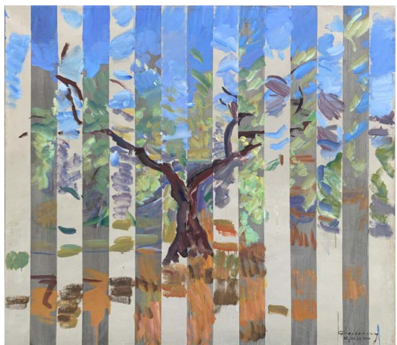
Olivo, 130 x 148 cm, VI, 2016