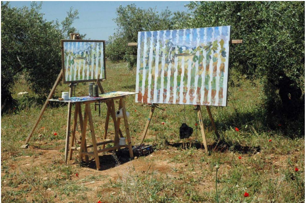
En el olivar