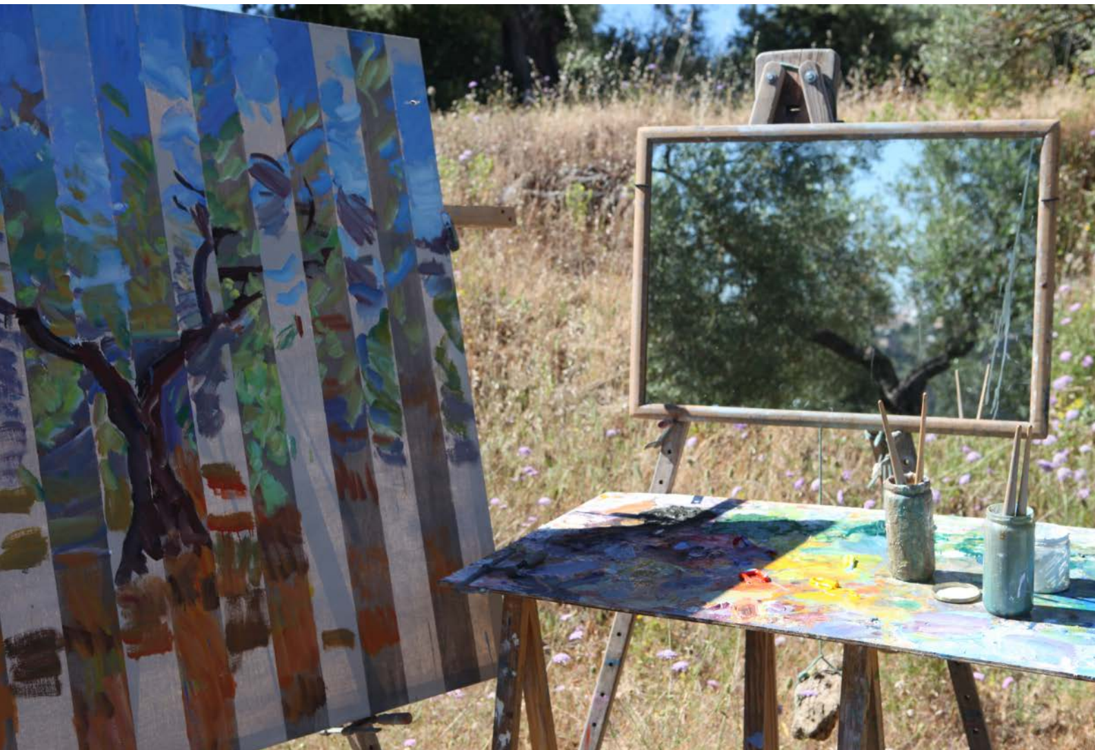
En el olivar (2016)