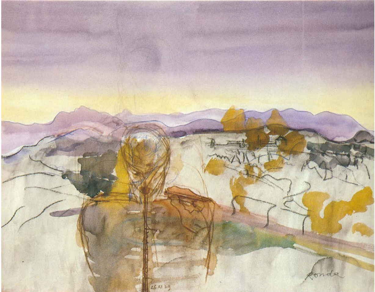
Et in arcadia ego II , óleo sobre vinilio, 114 x 152 cm, 1979

Combinación de dos vistas y un autorretrato