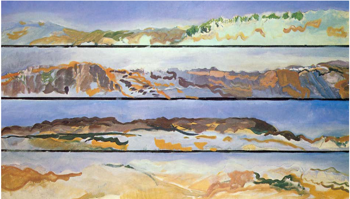
360 ° en Ronda, óleo sobre lienzo, 114 x 196 cm, 1978