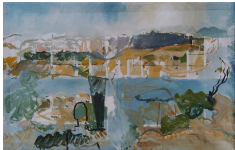
Et in arcadia ego I , óleo sobre vinilio, 114 x 177 cm, 1974