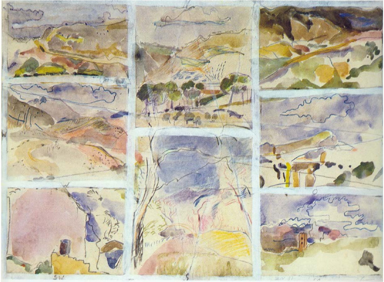
NOSE, acuarela y lápiz, 44,5 x 61 cm, 1977

En los paisajes “NOSE” el pintor indica direcciones como en un mapa: arriba en el centro está el Norte, abajo el Sur, a la derecha en el centro el Este y a la izquierda el Oeste. Los cuatro recuadros restantes de las esquinas corresponden al Noreste, Sureste, Suroeste y Noroeste.